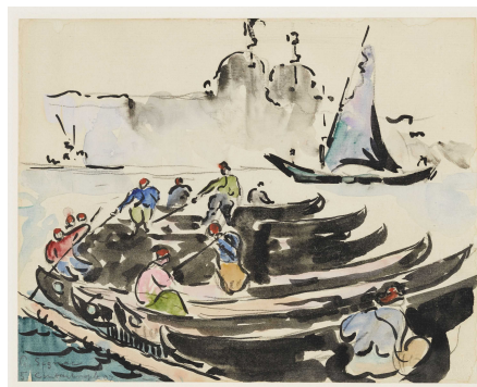
Digitalisierung der französischen und japanischen Graphik