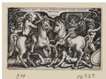
↗ Herkules raubt Jole, Blatt 10 der Folge "Arbeiten des Herkules", 1544