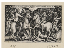
↗ Herkules raubt Jole, Blatt 10 der Folge "Arbeiten des Herkules", 1544