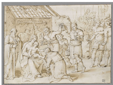
Restaurierung Niederländischer Zeichnungen des 15.-18. Jahrhunderts