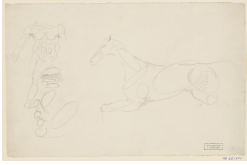
↗ Eugène Delacroix (*Charenton-Saint-Maurice 1798 - † Paris 1863), Zeichner Studie eines Mannes und eines Pferdes im "Ovalschema" , um 1822/24