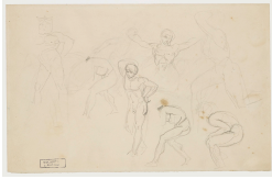
↗ Eugène Delacroix (*Charenton-Saint-Maurice 1798 - † Paris 1863), Zeichner Männliche Akte in Bewegung , 1813-1863