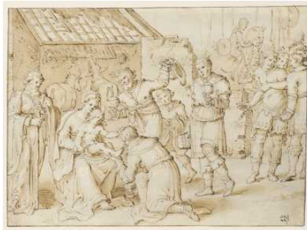
Restaurierung Niederländischer Zeichnungen des 15.-18. Jahrhunderts