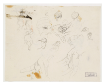
↗ Eugène Delacroix (*Charenton-Saint-Maurice 1798 - † Paris 1863), Zeichner Köpfe, Turbane und zwei Hände , 1821-1825