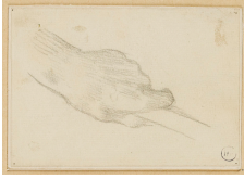
↗ Pierre Puvis de Chavannes (*Lyon 1824 - † Paris 1898), Zeichner Studie zu einer Hand , 1839-1898