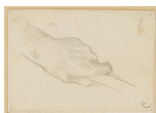
↗ Pierre Puvis de Chavannes (*Lyon 1824 - † Paris 1898), Zeichner Studie zu einer Hand , 1839-1898