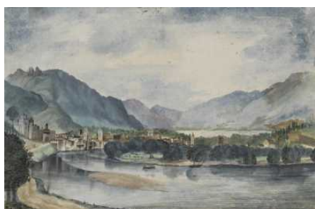
Die Sammlung Hieronymus