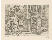
↗ Tobias Stimmer (*Schaffhausen 1539 - † Straßburg 1584), Formschneider Bathseba im Bade, von David belauscht , 1554-1584