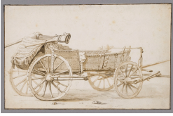
↗ Anonym, niederländisch, 17. Jahrhundert (*1601 - † 1700), Zeichner Poolsc Waghen , 17. Jahrhundert