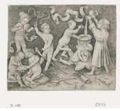
↗ Israhel van Meckenem II (*Meckenheim 1440 - † Bocholt 1503), Stecher Kinder verschiedene Spiele spielend , 1480-1490