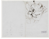
↗ Eugène Delacroix (*Charenton-Saint-Maurice 1798 - † Paris 1863), Zeichner Sitzende alte Frau im Bett (rechts), Einkaufsliste (links) , 1813-1863