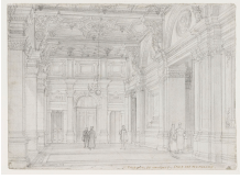
↗ Charles Fichot (*Troyes 1817 - † Paris 1903), Zeichner Wandelhalle des Handelsgericht , um 1861