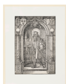
↗ Heiliger Sebald in der Nische , 1518