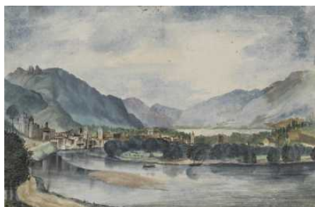
Die Sammlung Hieronymus Klugkist – Der Grundpfeiler des Bremer

↗ Die Sammlung Hieronymus Klugkist – Der Grundpfeiler des Bremer Kupferstichkabinetts