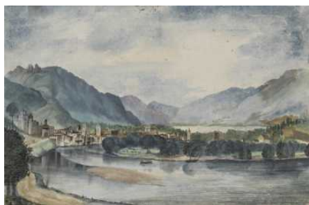
Die Sammlung Hieronymus Klugkist – Der Grundpfeiler

↗ Die Sammlung Hieronymus Klugkist – Der Grundpfeiler des Bremer Kupferstichkabinetts