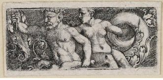
↗ Barthel Beham (*Nürnberg 1502 - † Italien 1540), Stecher Triton und Nereide , 1523-1524