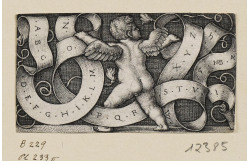
↗ Sebald Beham (*Nürnberg 1500 - † Frankfurt am Main 1550), Stecher Genius mit dem Alphabet , 1542