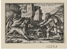
↗ Herkules und Cerberus, Blatt 7 der Folge "Arbeiten des Herkules", 1545