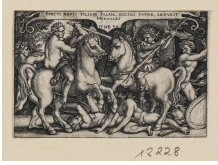
↗ Sebald Beham (*Nürnberg 1500 - † Frankfurt am Main 1550), Stecher Herkules raubt Jole, Blatt 10 der Folge "Arbeiten des Herkules", 1544