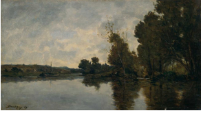
↗ Charles-François Daubigny (*Paris 1817 - † Paris 1878), Maler Flusslandschaft , 1869