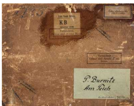
Provenienzforschung in der Kunsthalle Bremen