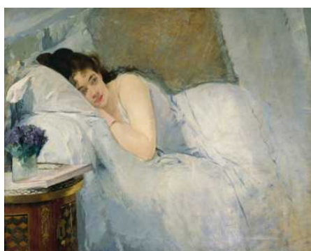
Französische Malerei vom Klassizismus zum Kubismus