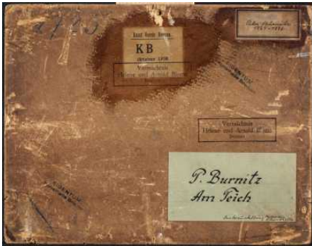
Provenienzforschung in der Kunsthalle Bremen