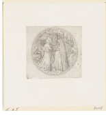
↗ Hans Leinberger (*1475 - † 1536), Stecher Heimsuchung Mariä , 16. Jahrhundert