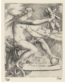
↗ Johann Ladenspelder (*1512 - † 1561), Stecher Fortuna , 1527-1561