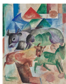
↗ Heinrich Campendonk (*Krefeld 1889 - † Amsterdam 1957), Maler Tiere auf der Weide , 1915