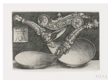
↗ Heinrich Aldegrever (*Paderborn 1502 - † Soest 1561), Stecher Zwei Löffel und eine Hundepfeife , 1539