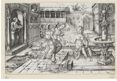
↗ Jakob Binck (*Köln 1500 - † Königsberg 1569), Stecher Bathseba im Bade , 1515-1569