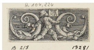
↗ Heinrich Aldegrever (*Paderborn 1502 - † Soest 1561), Stecher Ornament mit Putto zwischen zwei Delphinen , 1527