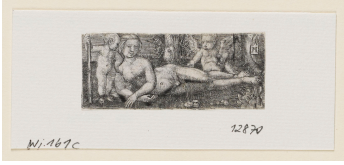
↗ Albrecht Altdorfer (*Regensburg 1482 - † Regensburg 1538), Stecher Liegende Venus mit Putten , um 1520/30