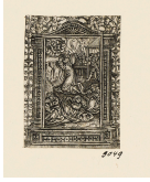
↗ Werkstatt von Monogrammist S (*um 1500), Stecher Christus am Ölberg, aus: "Passion Christi", 1515-1520