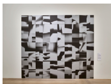
↗ Toulou Hassani (*Ahwaz, Iran 1984) Minus Something , 2016/17