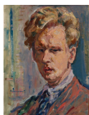
↗ Karl Dannemann (*Bremen 1896 - † Werder (Havel) 1945), Maler Selbstbildnis , 1920

Rolle des Malers in Malkittel und mit Palette.(3) Im vorliegenden Bild machen der kritische Blick und die lebhaft bewegten Züge den Eindruck einer unmittelbaren, spontanen Charakterstudie. Vielleicht ist es im Vorfeld des größeren Bildnisses entstanden.