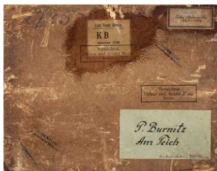
Provenienzforschung in der Kunsthalle Bremen