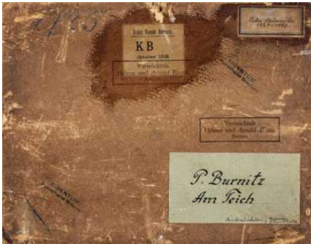
Provenienzforschung in der Kunsthalle Bremen