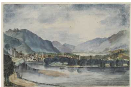
Die Sammlung Hieronymus Klugkist – Der Grundpfeiler des Bremer Kupferstichkabinetts

↗ Die Sammlung Hieronymus Klugkist – Der Grundpfeiler des Bremer Kupferstichkabinetts