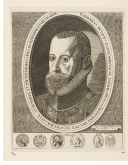
↗ Bildnis Friedrich II. von Dänemark , 1582