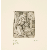
↗ Lucas Hugensz. van Leyden (*Leiden 1494 - † Leiden 1533), Stecher Franz von Assisi erhält die Stigmata , um 1514