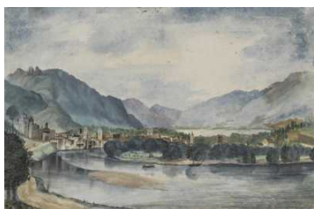
Die Sammlung Hieronymus Klugkist – Der Grundpfeiler des Bremer Kupferstichkabinetts