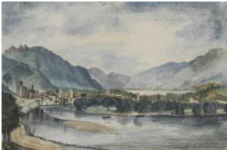
Die Sammlung Hieronymus Klugkist – Der Grundpfeiler des Bremer Kupferstichkabinetts