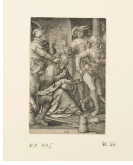
↗ Lucas Hogenz. van Leyden (*Leiden 1494 - † Leiden 1533), Stecher Verspottung Christi, Blatt 5 der Folge "Passion" , 1521