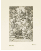
↗ Lucas Hogenz. van Leyden (*Leiden 1494 - † Leiden 1533), Stecher Abendmahl, Blatt 1 der Folge "Passion" , 1521