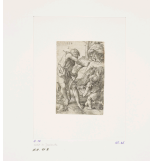
↗ Lucas Hugenst. van Leyden (*Leiden 1494 - † Leiden 1533), Stecher Lamech und Cain , 1524