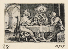
↗ Georg Pencz (*Nürnberg 1500 - † Bad Windsheim 1550), Stecher Christus in Emmaus, Blatt 18 der Folge "Leben Christi" , 1515-1550