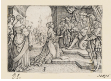
↗ Georg Pencz (*Nürnberg 1500 - † Bad Windsheim 1550), Stecher Esther vor Ahasver , 1515-1550