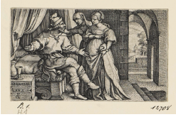
↗ Georg Pencz (*Nürnberg 1500 - † Bad Windsheim 1550), Stecher Abraham und Sarah, Blatt 1 der Folge "Geschichte des Abraham" , 1515-1550