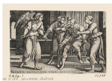
↗ Tobias und der Erzengel Raphael, Blatt 4 der Folge "Geschichte des Tobias", 1543