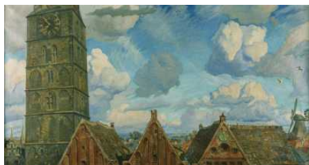
Bremer Malerei 1800 bis 1950 in der Kunsthalle Bremen

➤ Bremer Malerei 1800 bis 1950 in der Kunsthalle Bremen