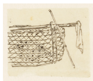
↗ Kyūzai Kawanabe (*1831 - † 1889), Zeichner Tragkorb, darin ein Igel oder Tanuki , 1846-1889