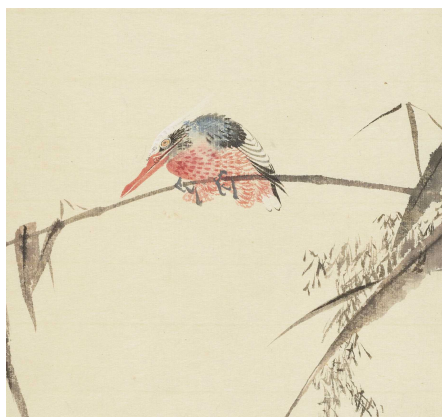
Restaurierung der japanischen Handzeichnungen