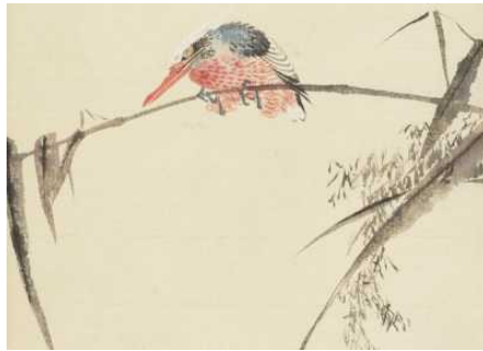
Restaurierung der japanischen Handzeichnungen