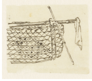
↗ Kyūtsai Kawanabe (*1831 - † 1889), Zeichner Tragkorb, darin ein Igel oder Tanuki , 1846-1889