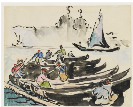
Digitalisierung der französischen und japanischen Graphik