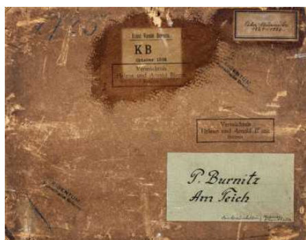
Provenienzforschung in der Kunsthalle Bremen