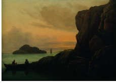
↗ Carl Gustav Carus (*Leipzig 1789 - † Dresden 1869), Maler Abend am Meer , um 1820/25