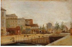
↗ Stanislas Lépine (*Caen 1835 - † Paris 1892), Maler Der Canal Saint-Martin in Paris mit Schleuse , undatiert